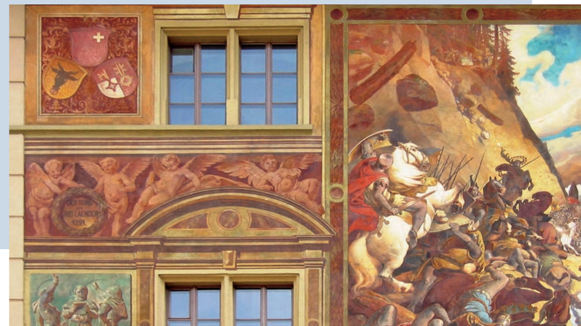
Rathaus Schwyz, Originalanstrich von 1891