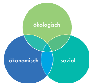
Nachhaltigkeit als Handlungsprinzip