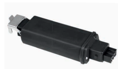
Steckbares F-Con Funk-Modul für einfachen Anschluss zusätzlicher Motoren, Geräte, Leuchten