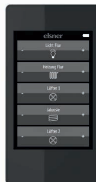
Funk-Fernbedienung Remo pro

Die im Steuerungssystem integrierte Funktechnik bietet Ihnen die Freiheit Ihre Haustechnik auch in Zukunft zu erweitern und an geänderte Bedürfnisse anzupassen. Auch für denkmalgeschützte Gebäude ist die kabellose Technologie ideal.